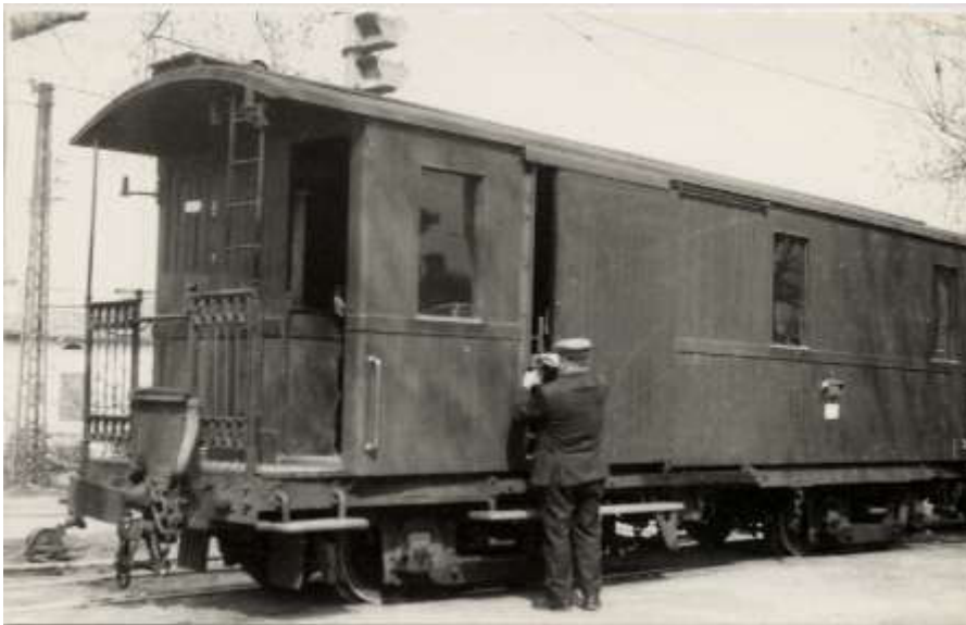
El furgó correu del Ferrocarril de Sóller. A la dreta es veu la bústia.

En un principi el servei d'ambulant es continuà prestant a bord dels furgons de càrrega de la companyia; fins que el 1931 s'adquiriren tres furgons específics de correus a la CAF de Beasain. Aquests furgons començaren a prestar servei el 1932 i ho feren de manera ininterrompuda fins al 15 de juny de 2001, aquest dia els furgons que encara circulaven com complement del tren foren definitivament retirats. El seu destí ha estat anar un d'ells cedit al Museu Ferroviari de Saragossà, un altre com oficina d'informació turística a la plaça de Sóller, el tercer ha quedat en propietat del ferrocarril que no descarta fer-lo marxar qualche dia. Per tant deu anys després de la supressió del servei de correus a la línia Palma - Sóller.