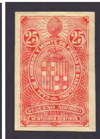
Tipo - 4Bs,a