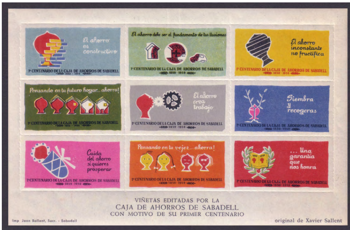
HB 1959 - 3·11

1959 - HB 1, HB 2, HB 3·11: I Centenario de la Caja de Ahorros de Sabadell