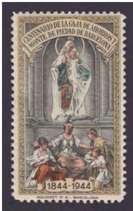
1944 - 1

La Caja de Ahorros y Monte de Piedad de Barcelona fue una caja de ahorros fundada en 1844 a raíz de un proyecto que se estudiaba desde 1835 por parte de la Sociedad Económica de Amigos del País, la Real Junta Particular de Comercio de Barcelona y el Ayuntamiento de Barcelona. Nació tras la entrada del general Prim en Barcelona en junio de 1843, en un contexto histórico de eclosión de proyectos fundamentales para la economía barcelonesa como la demolición de parte de las murallas de poniente, la apertura de la calle Ferran, el proyecto de construcción del Gran Teatro del Liceo, el primer ferrocarril de España, que unió Barcelona con Mataró, etc.