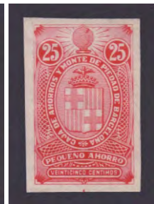
Tipo - 3Bs