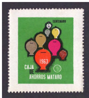
1963 - 1

La Caixa d'Estalvis de Mataró fue una entidad fundada el 8 de febrero de 1863 en Mataró (Maresme), una idea que se había comenzado a gestar en una reunión el 8 de julio de 1859 y que cuatro años más tarde se hizo realidad, siendo la tercera entidad de ahorros creada en Cataluña y que de inmediato comenzó a implicarse en diversas iniciativas sociales, relacionadas con la construcción de grupos escolares y viviendas sociales, que requería el municipio de Mataró.