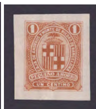
Tipo - 1As