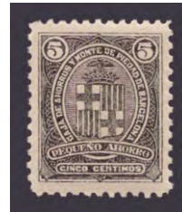
Tipo - 1B