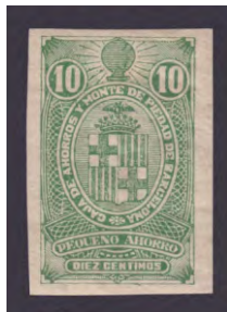
Tipo - 3As