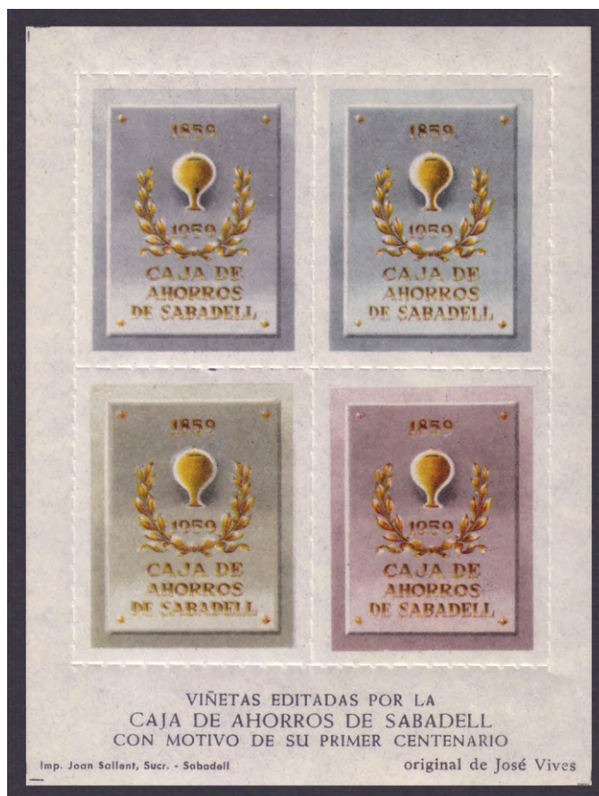
HB 1959 - 1A·1D