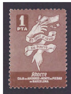
Tipo - 8