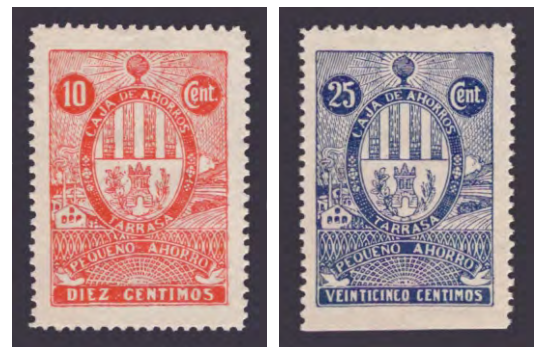
Tipo - 1

En junio de 2009, con la aprobación del Fondo de reestructuración ordenada bancaria (FROB), Caixa Terrassa entró en un proceso de fusión con Caixa Sabadell y Caixa Manlleu, que se hizo realidad el 17 de mayo de 2010 con la constitución de una nueva caja que inició sus operaciones a partir del 1 de julio de ese mismo año. El nombre social de la caja resultante fue Caixa d'Estalvis Unió de les Caixes de Manlleu, Sabadell i Terrassa, que ubicó su sede social en Barcelona.