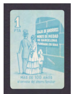
Tipo - 9Cs