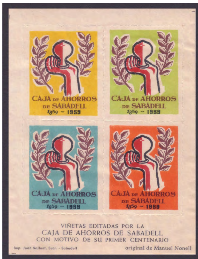
HB 1959 - 2A·2D