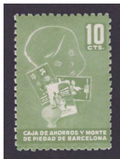
Tipo - 6