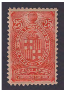
Tipo - 2