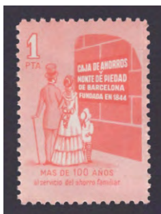
Tipo - 9A