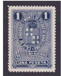
Tipo - 5