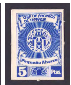
Tipo - 3