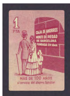
Tipo - 9Bs