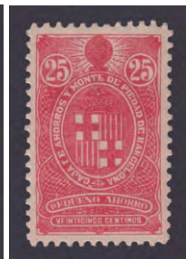
Tipo - 4B