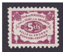
Tipo - 1