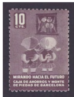
Tipo - 7