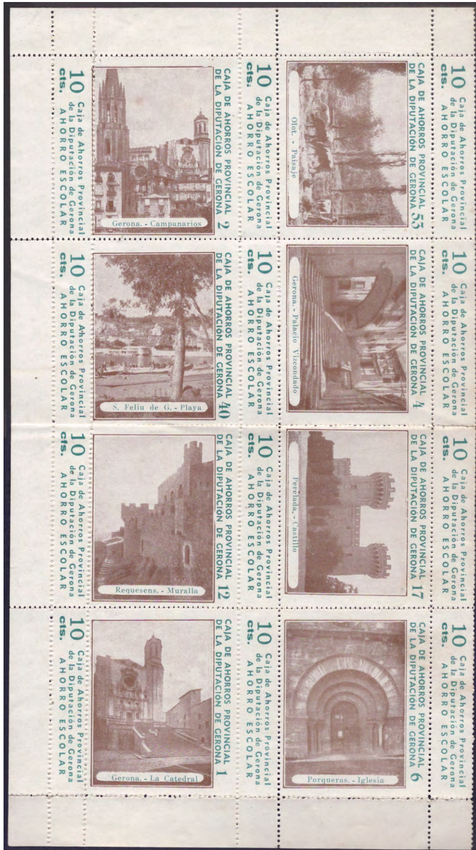
imagen reducida 20 %