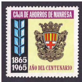
1965 - 1

El proceso de fusión recibió luz verde el 13 de octubre de 2009 siendo así la segunda gran integración de cajas catalanas. Esta fusión se caracterizó por integrar dos cajas públicas: Caixa Catalunya de la Diputación de Barcelona y Caixa Tarragona de la Diputación de Tarragona con una de propiedad privada: Caixa Manresa, lo que significó el despido de 1.300 empleados y el cierre de 395 de las antiguas oficinas.