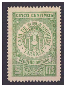
Tipo - 2