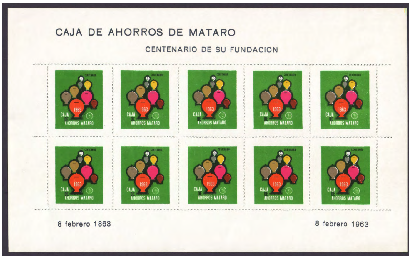
HB 1963 - 1

crédito. El acuerdo fue tomado por una comisión gestora designada por la Generalitat de Catalunya dando cumplimiento a la normativa para la obras sociales de las cajas que se desvincularon de la actividad financiera. La Fundació Lluro administra los fondos de la obra social de la entidad, manteniendo su foco principal en la atención social y la cultura.