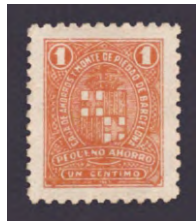
Tipo - 1A