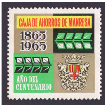
1965 - 2