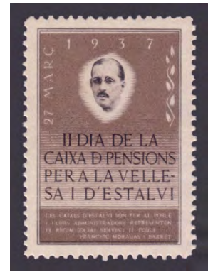
1937 - 1