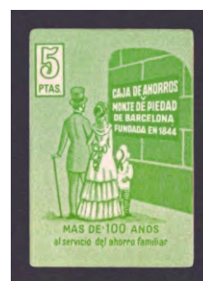
Tipo - 9Ds