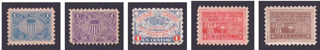
Tipo - 1A