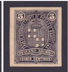
Tipo - 1Bs