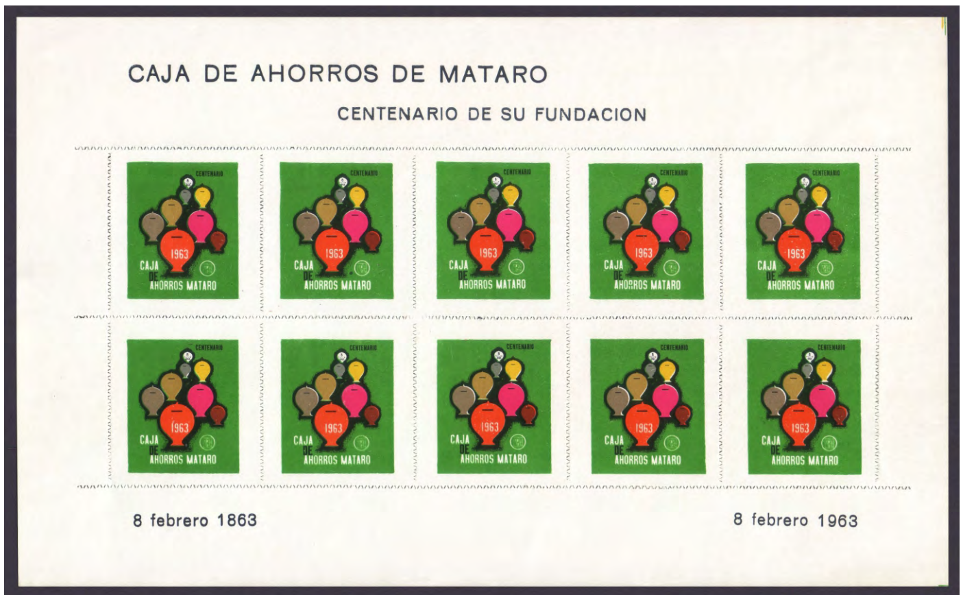
HB 1963 - 1

crédito. El acuerdo fue tomado por una comisión gestora designada por la Generalitat de Catalunya dando cumplimiento a la normativa para la obras sociales de las cajas que se desvincularon de la actividad financiera. La Fundació Lluro administra los fondos de la obra social de la entidad, manteniendo su foco principal en la atención social y la cultura.