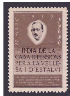
1937 - 1