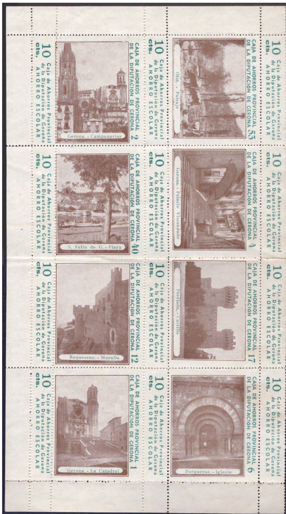
imagen reducida 20 %