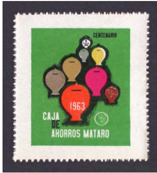
1963 - 1

La Caixa d'Estalvis de Mataró fue una entidad fundada el 8 de febrero de 1863 en Mataró (Maresme), una idea que se había comenzado a gestar en una reunión el 8 de julio de 1859 y que cuatro años más tarde se hizo realidad, siendo la tercera entidad de ahorros creada en Cataluña y que de inmediato comenzó a implicarse en diversas iniciativas sociales, relacionadas con la construcción de grupos escolares y viviendas sociales, que requería el municipio de Mataró.