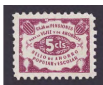
Tipo - 1