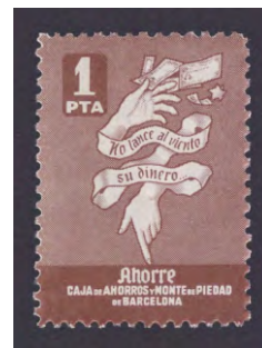
Tipo - 8