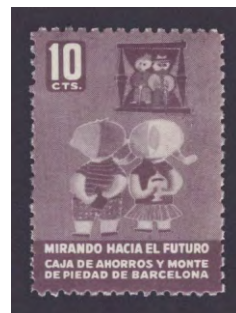
Tipo - 7