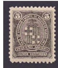
Tipo - 1B