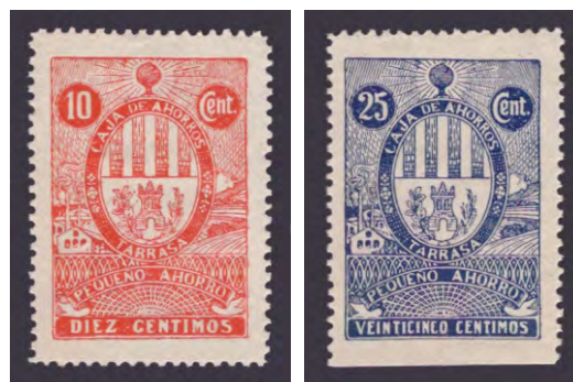
Tipo - 1

En junio de 2009, con la aprobación del Fondo de reestructuración ordenada bancaria (FROB), Caixa Terrassa entró en un proceso de fusión con Caixa Sabadell y Caixa Manlleu, que se hizo realidad el 17 de mayo de 2010 con la constitución de una nueva caja que inició sus operaciones a partir del 1 de julio de ese mismo año. El nombre social de la caja resultante fue Caixa d'Estalvis Unió de les Caixes de Manlleu, Sabadell i Terrassa, que ubicó su sede social en Barcelona.