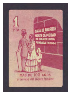
Tipo - 9Bs