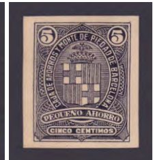
Tipo - 1Bs