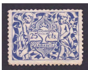
Tipo - 1