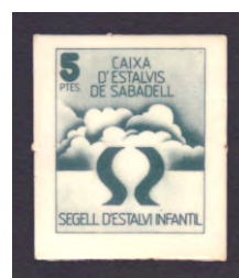
Tipo - 2