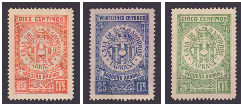
Tipo - 2