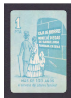
Tipo - 9Cs