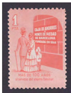
Tipo - 9A