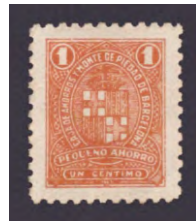
Tipo - 1A