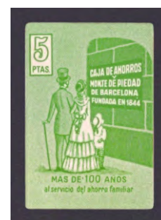
Tipo - 9Ds