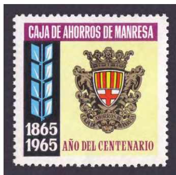
1965 - 1

El proceso de fusión recibió luz verde el 13 de octubre de 2009 siendo así la segunda gran integración de cajas catalanas. Esta fusión se caracterizó por integrar dos cajas públicas: Caixa Catalunya de la Diputación de Barcelona y Caixa Tarragona de la Diputación de Tarragona con una de propiedad privada: Caixa Manresa, lo que significó el despido de 1.300 empleados y el cierre de 395 de las antiguas oficinas.