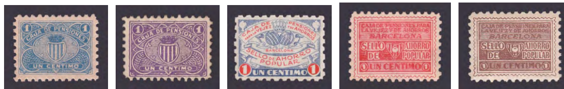
Tipo - 1A