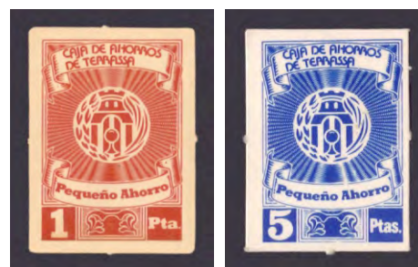
Tipo - 3