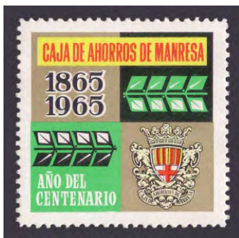
1965 - 2